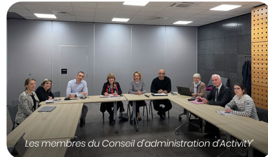
Les membres du Conseil d'administration d'Activity'

L'articulation entre les partenaires du service public de l'emploi - Services déconcentrés de l'État, France travail, services départementaux, - et les acteurs économiques du territoire - employeurs, acheteurs publics et privés, fédérations d'entreprises a permis d'adosser les parcours d'insertion aux opportunités d'emploi identifiées dans les filières de l'ouest francilien et de mieux valoriser le potentiel de compétence des candidats.